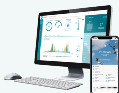
Suite logiciel MyLight Systems